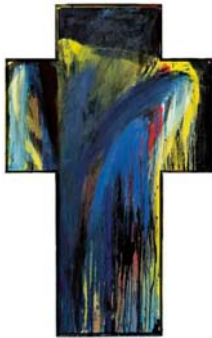
Arnulf Rainer, Kreuz

Bei der zeitgenössischen Kunst hat sich im Kinsky vorgenommen, alle bedeutenden österreichischen Künstler mit einer wichtigen Arbeit zu präsentieren. Franz West ist mit seinem vor 1982 aus Papiermaché, Karton und Strohmatte geschaffenen „ Direktionstisch “ vertreten, der bis Ende September 2008 das Topobjekt der Ausstellung „Sit on My Chair, Lay on My Bed“ im MAK war (€ 250.000 – 350.000). Aus der Gnadenlos-Ausstellung im MAK Ende 2001 stammen von ihm 5 Collagen „ Miete/Rent “ (150.000 – 250.000).