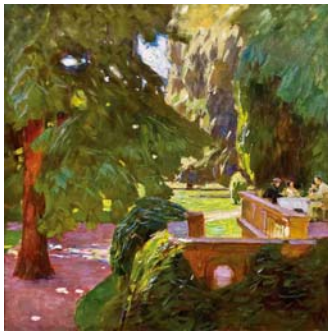
Carl Moll, Villa Primavesi

Vom Umfang her nicht groß, aber gewichtig ist die Gruppe von Gemälden der Klassischen Moderne. Beginnend mit fünf besonders schöne Zeichnungen von Gustav Klimt , überwiegend Akte, in einem Fall aber auch Adele Bloch-Bauer mit Hut – die Schätzwerte bewegen sich hier jeweils zwischen € 60.000 und 120.000. Otto Rudolf Schatz , der zuletzt so erfolgreich bei Auktionen im Kinsky war, startet mit „ Die schlechte Nachricht “ (€ 180.000 – 250.000) und dem „ Blick auf den Stephansdom vom ersten Wiener Hochhaus “ (€ 130.000 – 200.000). Zwei Ölbilder, von denen das eine um 1944 entstand und von Leere und Hoffnungslosigkeit erzählt und das andere, um 1955, von einem Blick in eine bessere, hellere Zukunft.