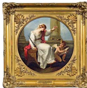
Angelika Kauffmann, Justitia